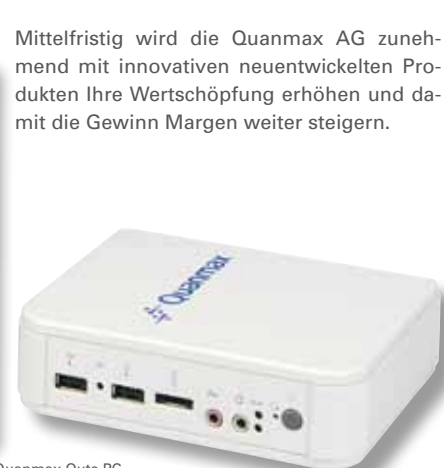
Quanmax Quite PC

Mittelfristig wird die Quanmax AG zunehmend mit innovativen neuentwickelten Produkten Ihre Wertschöpfung erhöhen und damit die Gewinn Margen weiter steigern.